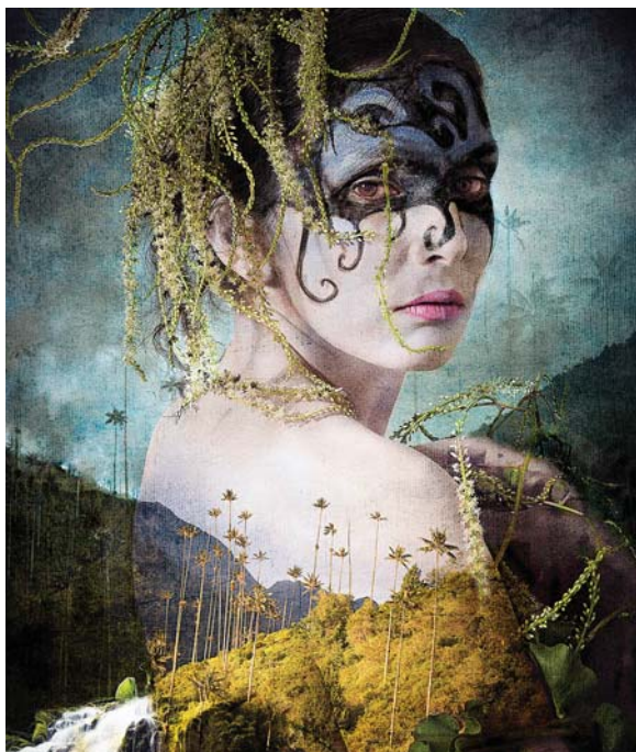
Detail: La Llorona by Alex. Usquiano (Colombia)

TAP Centre for Creativity ~ 203 Dundas Street, London, ON Hours: Tuesday to Saturday 12:00 noon - 5:00 pm Tel: 519-642-2767 • www.tapcreativity.org